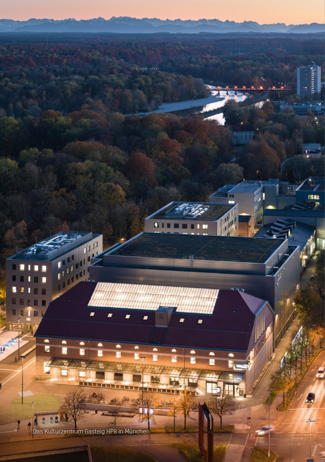
Das Kulturzentrum Gasteig HP8 in München